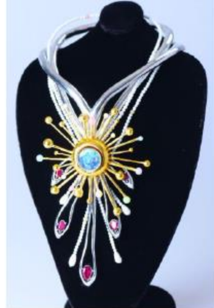
圖 5-3.3__霍金金工飾品作品欣賞