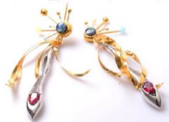
圖 5-3.4__霍金金工飾品作品欣賞